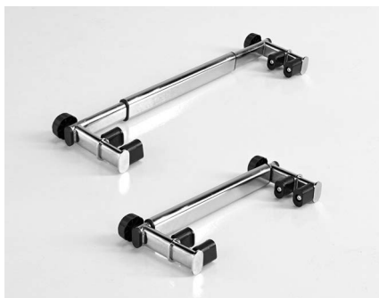
Barra ajustable para el Yack 962 y Yack 963.