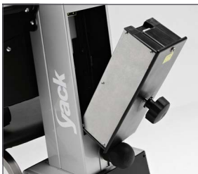
Batería desmontable para facilitar la recarga.

El Yack es el salva escaleras que permite subir y bajar escaleras rectas y de caracol. Se va adaptando a las necesidades del paciente, pasando del modo asiento (Yack 961) al modo silla de ruedas (Yack 962 / 963). Desmontable en diferentes secciones para facilitar su traslado. Con batería desmontable que permite su recarga sin mover todo el equipo.