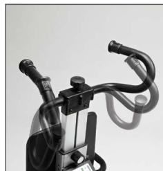
Timón regulable en altura y ajustable para adaptarlo al cuidador.