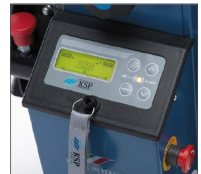
Nuevo panel de control digital que permite introducir al cuidador diversos parámetros (velocidad, modo de subir las escaleras -individualmente/ciclo continuo...) garantizando un uso seguro y simple del sube escaleras.