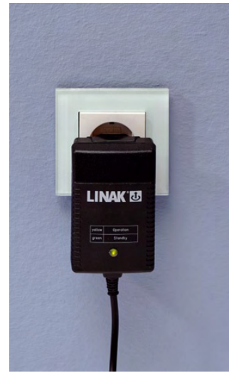
Adaptador de corriente eléctrica integrado directamente en la parte trasera del enchufe de conexión a la red (sistema eléctrico de 24 V)