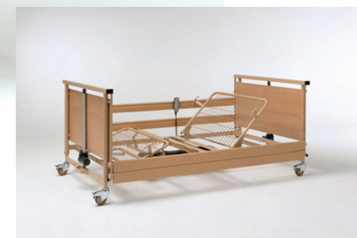
Allura MIGHTY - 120 x 200 cm.