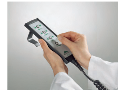
Mando con función de bloqueo selectivo