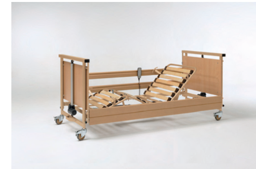
Allura 90 - 90 x 200 cm.