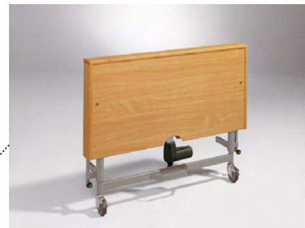
Embellecedor disponible como opción