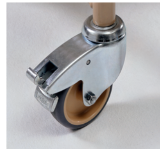
Rueda de alta calidad y robusta TENTE