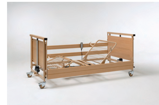
Allura 100 - 100 x 200 cm.