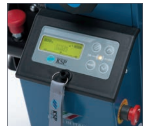
Nuevo panel de control digital que permite introducir al cuidador diversos parámetros (velocidad, modo de subir las escaleras -individualmente/ciclo continuo...) garantizando un uso seguro y simple del sube escaleras.