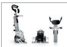
Desmontable en diferentes secciones: mástil, columna y asiento (según modelo), lo que facilita su transporte.