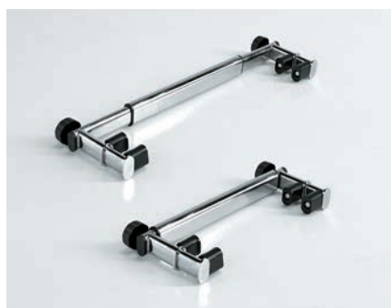
Barra ajustable para el Yack 962 y Yack 963.