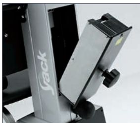
Batería desmontable para facilitar la recarga.

El Yack es el salva escaleras que permite subir y bajar escaleras rectas y de caracol. Se va adaptando a las necesidades del paciente, pasando del modo asiento (Yack 961) al modo silla de ruedas (Yack 962 / 963). Desmontable en diferentes secciones para facilitar su traslado. Con batería desmontable que permite su recarga sin mover todo el equipo.