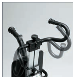
Timón regulable en altura y ajustable para adaptarlo al cuidador.