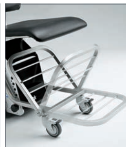
En el Yack 961 los reposabrazos y reposapiés son abatibles para mayor confort del usuario.